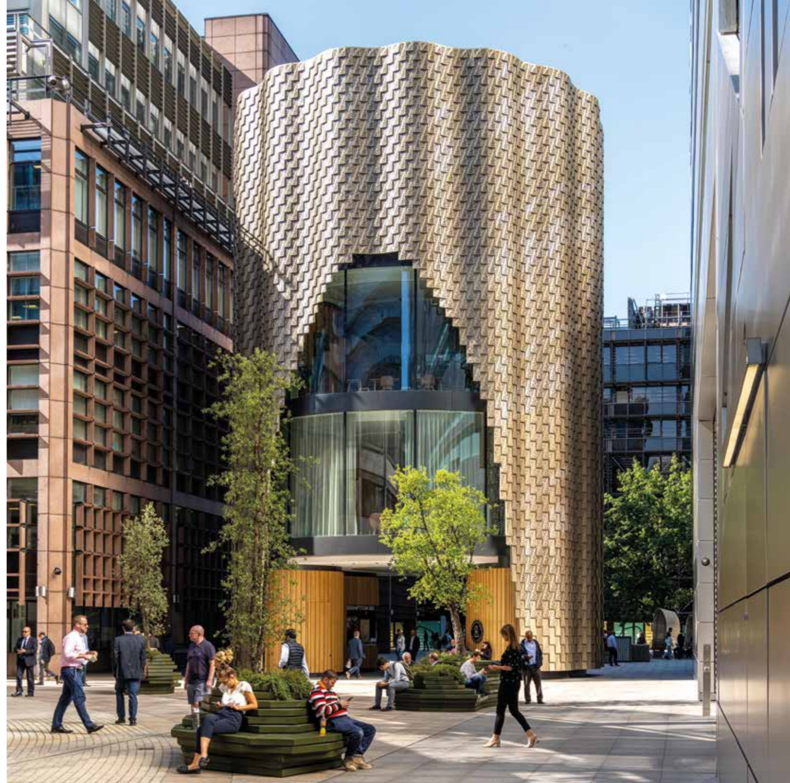
3 Broadgate - London - UK