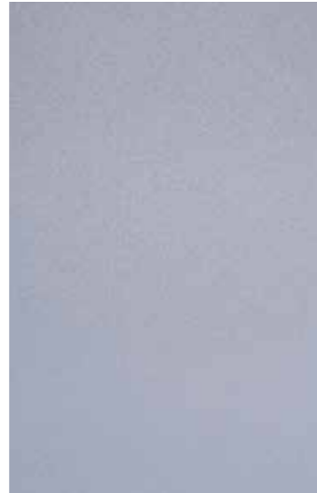
POHL DURANIZE BRIGHT SPARKLE SILVER