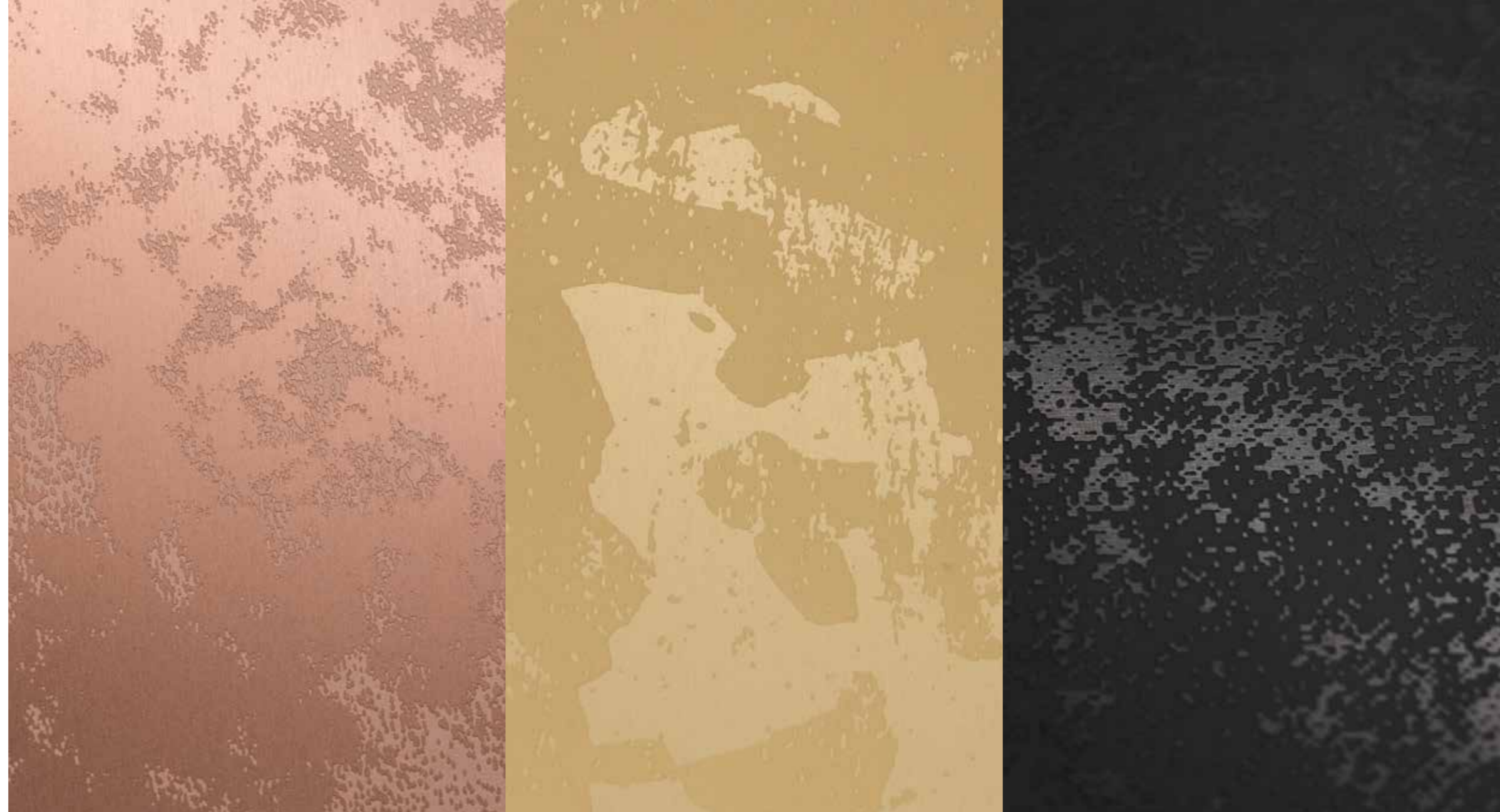
DESIGN-BEISPIELE FÜR POHL DURANIZE BICOLOR

POHL Duranize Bicolor basiert auf dem Einsatz von zwei oder mehr Eloxalschichten. Durch die Kombination von verschiedenen Farben, matten oder glänzenden Effekten und auffälligen Mustern kann die Oberfläche individuell gestaltet werden und erhält dadurch einen unverwechselbaren Look.