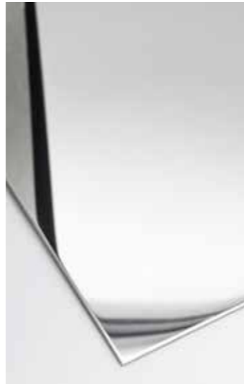
HIGH GLOSS – HOCHGLÄNZENDE OBERFLÄCHE IN SPIEGELOPTIK