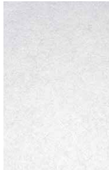
VIBRATION – RICHTUNGSLOSER SCHLIFF MIT FILIGRANER OPTIK