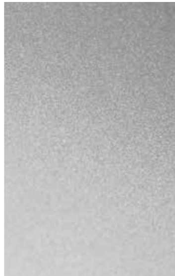
BEAD BLASTED – GLEICHMÄSSIGE, SEIDENMATTE OBERFLÄCHE

Dorotheen Quartier · Stuttgart · Germany