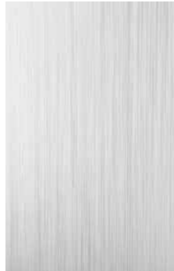
STRAIGHT – GERICHTETER SCHLIFF MIT STRUKTUR

Hochglänzende Spiegeloberflächen sind perfekt für nahtlose Übergänge und eignen sich ideal für moderne Innenräume. Ihr starkes Reflexionsvermögen lässt Objekte mit der Umgebung verschmelzen und erzeugt dabei faszinierende Effekte bis hin zur scheinbaren Entmaterialisierung.