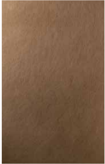
POHL DURANIZE BRONZE VIBRATION