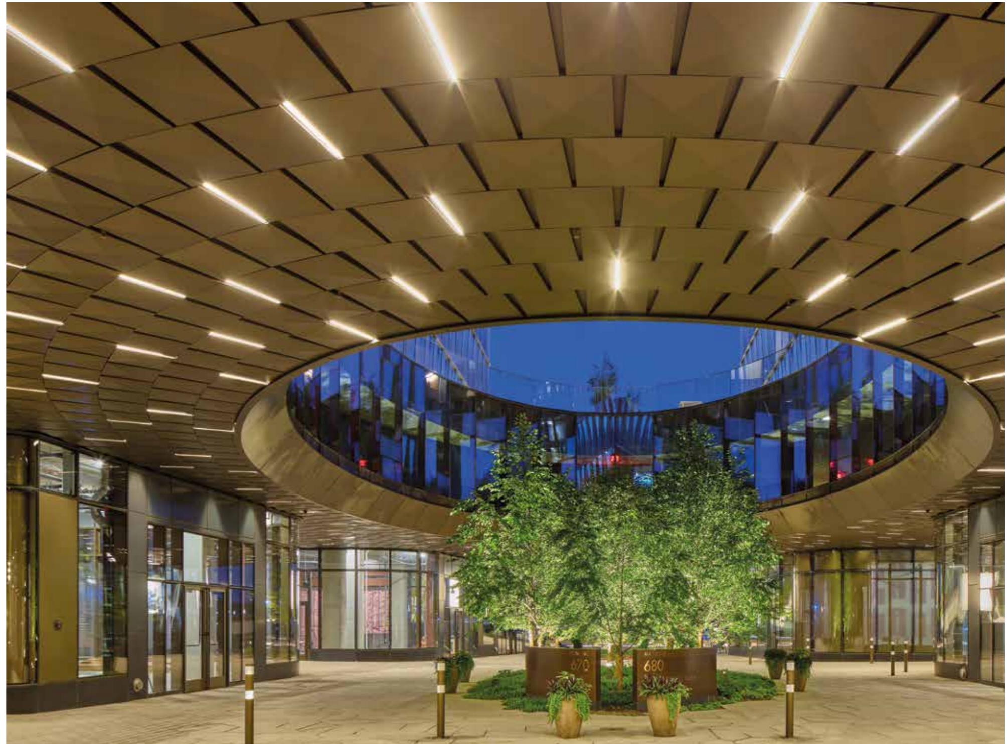
The Wharf · Washington DC · USA