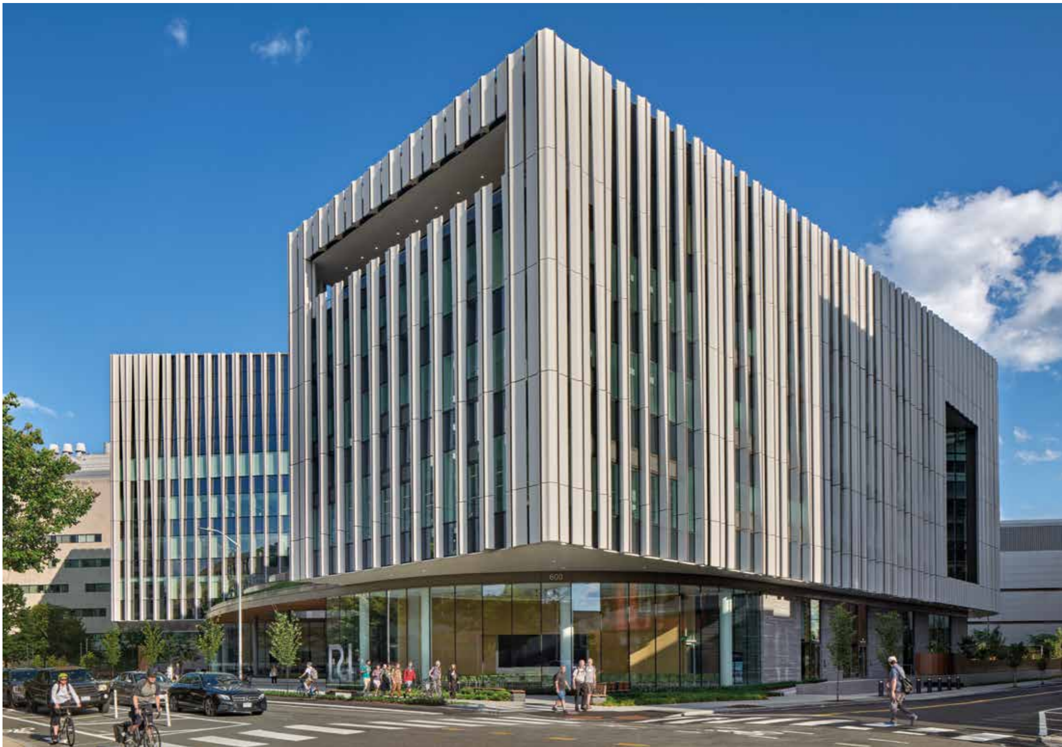
Ragon Institute · Cambridge · USA